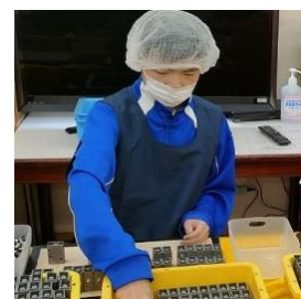
つくし共同作業所