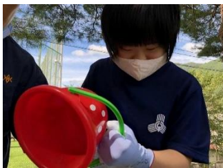
釜石球技場環境整備 (松ぼっくり拾い、ベンチ清掃)