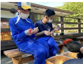
まごころ就労支援センター釜石