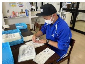
釜石市福祉作業所