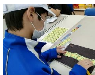
かまいしワーク・ステーション